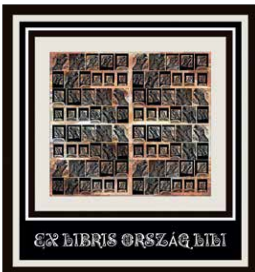
Palásti Erzsébet: Ex libris Ország Lili , elektrografika, 2019, 170×160 mm

Palásti Erzsébet sokszínű, modernségtől áthatott, az irodalommal szoros összefonódást mutató