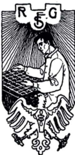
2. ábra. Röttig Gusztáv és Fia Nyomda (nyomdász-jelvény)