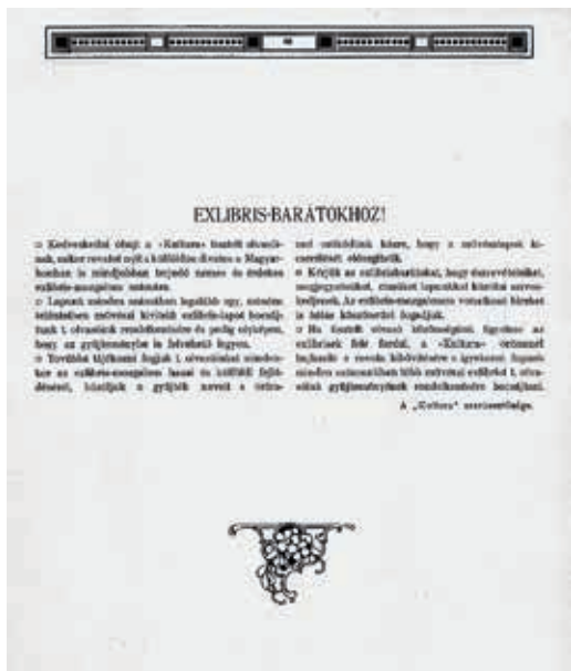
5. ábra. Felhívás ex libris gyűjtőkhöz (Kultura, 1911/1.)