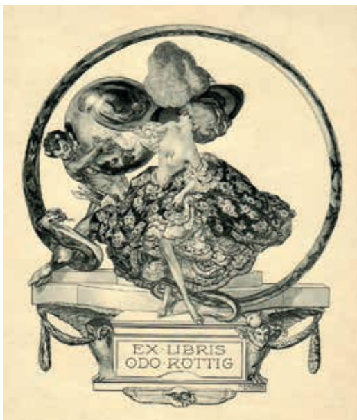
6. ábra. Röttig Odo ex librise (grafikus: Franz von Bayros)

Holl Jenő stb. és persze maga Röttig Odo. 9 Külföldiek (osztrákok és németek) is csatlakoztak. A Röttig Gusztáv és Fia cég a csereforgalomhoz szükséges nyomtatványokat is forgalmazott, minden kívánt nyelven. Emellett vállalta rajzok után ex libris lapok elkészítését, és elsődrendű művészek rajzának megszerzését.