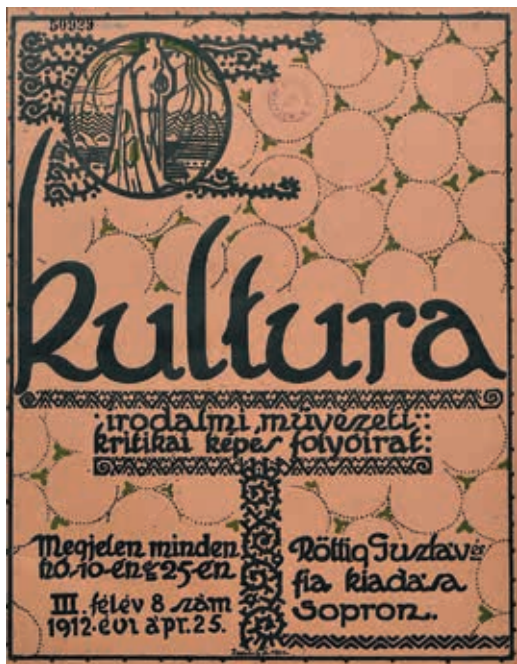
3. ábra. Kultura folyóirat, 1912

szerkesztette a vasárnapi mellékletet, 4 szépség-ápolási, divatbeli és művészeti témákban. Röttig Odo 1919-ban Vierburgenland (jelentése: 'négy vár területe') néven alapított újságot, mely Sopronban havonta két alkalommal jelent meg az Ausztria által elszakítani kívánt négy nyugat-magyarországi vármegyében lakó német ajkú lakosság számára. Az irodalmi, művészeti, kritikai lap 1920-ig állt fenn.