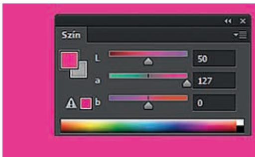
2. ábra. A CIELAB színtér a^* tengelyének pozitív végpontja bíbor színezetű

A belenyúlás szó eléggé pongyola megfogalmazás, de azt szokták érteni alatta, hogy egyes grafikai elemeket javítanak, felesleges jeleket eltávolítanak, színkonverziót végeznek stb. Valóban jó,