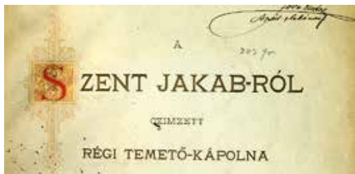
A Szent Jakabról címzett régi temető-kápolna (Sopron 1887, Litfass Károly könyvnyomdájában)

mélyében kiváló szakember került a nyomda élére, aki amellet Sopron közéletében is szerepet vállalt. Részt vett a Városszépítő Egyesület munkájában, a természetjárás népszerűsítése érdekében 1876-ban fiával közösen, saját költségen kilátót, ahogy nevezték „messzelátótornyot” ácsoltattak. Ezt a 20. század elején kőépületre cserélték le, de Romwaltertől kapott neve, a Károly-kilátó változatlan maradt. Jelentős része volt Sopron helytörténeti kutatásában, megismertetésében. Csaknem fél évszázadig volt a nyomda élén, 1850-től 1895-ig, ami annak különösen javára vált, minthogy modern eszközökkel szerelt fel a műhelyt és kiadványai nemcsak külsejükben, hanem tartalmukban is igényesek voltak. Műhelyét 1895-ben könyvnyomó intézettel bővítette. Több helyi sajtótermék is nyomdájában készült, így az Oedenburger Zeitung , amely még 1944-ig élt, de magyar nyelvű lapot is adott ki Soproni Újság néven.