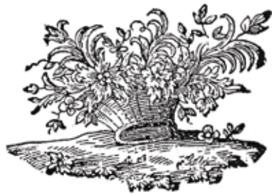
Könyvdíszek a soproni Siess-nyomdából az 1770-es évekből