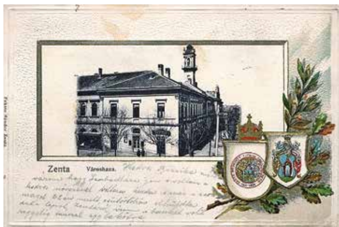
Zentai képeslap a városházával és a település címerével (1915 körül)