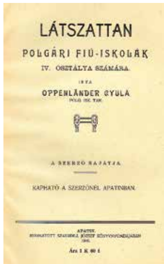
Apatini tankönyv címlapja 1910-ből

Barcsy Zsigmond 1874–1884 között működő nyomdájából egy mű ismert. Fekete (Schwartz) Sándor nyomdája 1881–1915 között üzemelt,