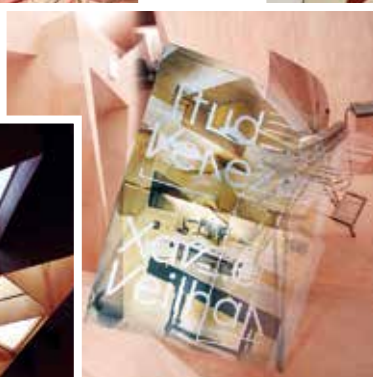
A francia pavilon zenei központjában csodálatos fa burkolat, tér és ritmus egyszerre. Xavier Veilhan, Studio Venezia – hirdeti az igényes tipográfia. Zenei élményeket kínál.