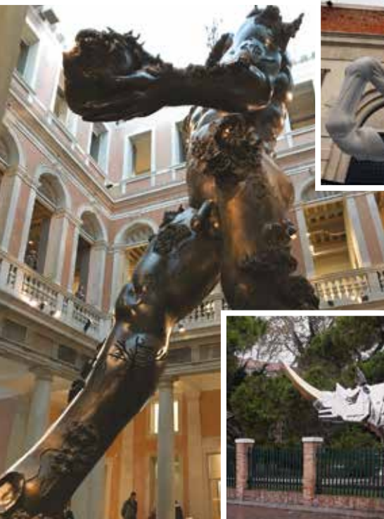
Damien Hirst: férfiktja – egészen jól felismerhető. A művész gigantikus, néha szarkasztikusnak tűnő szobrai két külön épületben kaptak helyet.