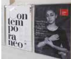
Shirin Neshat : The Home of My Eyes – digitális showja a Museo Correr antik szobrai közé költözött.