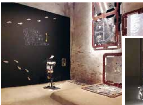
Alicjka Kwarde Weltenlinie , tükör a tükörben.