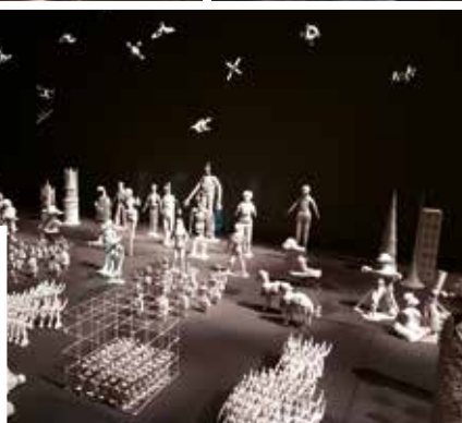
...fény-árnyék-animáció. Valamint egy applikáció: digitális szobrok röntgenképe.