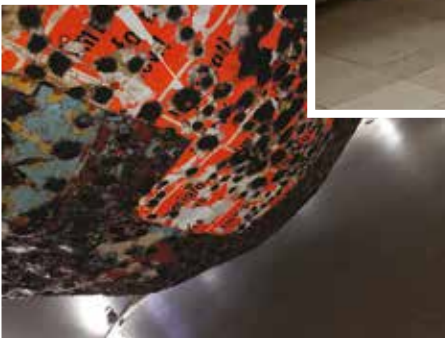
Az emberiséget mint egyre növekvő lavina fenyegeti a migráció, avagy a kommunikáció sötét gömbje... az amerikai pavilonban. Ázsia kis tigrise Korea neonfényekbe öltözött. Welcome, pole dance, free video, free narcissistic people disorder, free peep show –Take it easy–