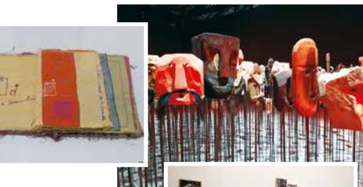
Bernardo Oyarzun maszkokból készített installációja.