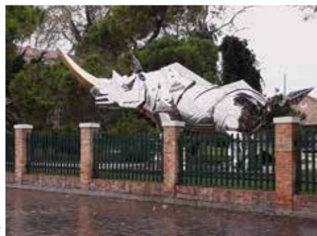
Nem Dürer, de rinocérosz.