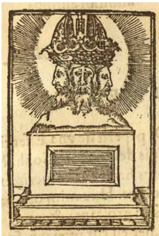
A botrányos fametszetsorozat egyik darabja