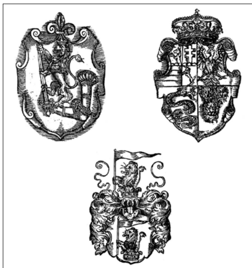
Raphael Hoffhalter metszete János Zsigmond erdélyi fejedelem címeréről

A 18. századi unitárius forrás bizonytalan abban, hogy a nyomtatóműhely János Zsigmond vagy az unitárius vallásközösség költségén létesült-e. Egyes felvetés szerint maga a fejedelem királyi mesterét a nyomtatóműhellyel egyetemben átengedte az unitáriusoknak használatra, hogy