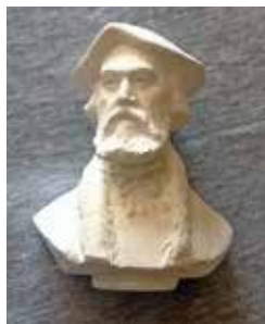
Misztótfalusi Kis Miklós

Hálás szívvel köszönjük mindkét szobrászművésznek, hogy ügyünk mellé példás nagylelkűséggel álltak, és lehetővé teszik alkotásaikkal az ölbeművelését, így megmenthetjük azokat az utókor számára egy művészi alkotásba öntve.