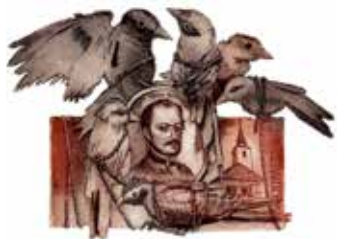
Lenkey István könyve, grafikus Vén Zoltán

hanem a készítettő kedvelt időtöltéseire, hobbjára, szeretett költőjére-írójára, zeneművére, történelmi alakjára, városára, épületére stb. Az ex librisek közt vannak irodalmi,