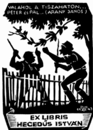
Ex libris Hegedűs István, grafikus Várkonyi Károly