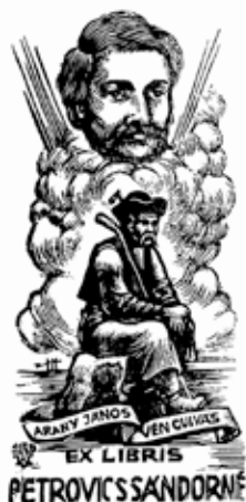
Ex libris Petrovics Sándorné, grafikus Várkonyi Károly