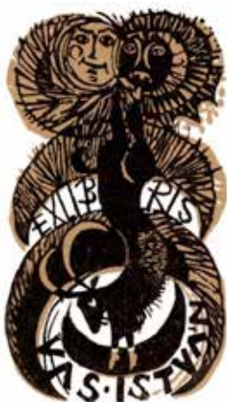
Ex libris Vas István, grafikus Diskay Lenke

A gyűjtők többsége nemcsak meglévő lapokkal cserél, hanem saját nevére is készíttet ex librist, alkalmi grafikát. Ötven–száz példányt nyomat-