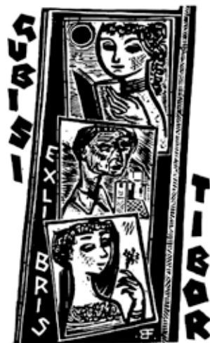
Ex libris Gubisi Tibor, grafikus Bordás Ferenc

badításával szerzett érdemeket (1676). Lenkey vallási vonatkozású ex librisei egy részét a montserrati kolostorban élő spanyol szerzetes, Oriol M. Diví alkotta. Vele Lenkey személyes kapcsolatban állt.