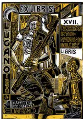
Ex libris familia Boschetti, grafikus Józsa János