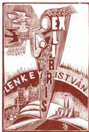
Ex libris Lenkey István, grafikus Józsa János

Idén, a reformáció 500. év- fordulóján fontosnak tartom megemlíteni, hogy a Lenkey István nevére szóló ex librise- ken és gyűjteményében is fontos szerepet kap a vallási vonatkozás. Életében kulcsfon- tosságú a hit, nem lehet vélet- len, hogy október 31-én, a reformáció napján született Miskolcon. „A teológiai tanul- mányaim egy általános világ- képet és tudományképet adtak, s ezekből már könnyebb volt