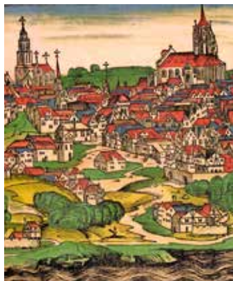
Buda korabeli ábrázolása a Schedel-krónikából (1493)

ról 1889-ben értesültek először Magyarországon, amikor a londoni Sotheby cég aukcióján ez a példány aukcióra került. A krakkói példányról úgy szereztünk tudomást, hogy amikor Chartorisky László herceg 1871-ben a Magyar Nemzeti Múzeum könyvtárában járt, Mátray Gábornak említette, hogy saját könyvtárában is van a Chronicából egy példány. A szentpétervári példányról Ballagi Aladár (1925) tudósított, megemlítve, hogy