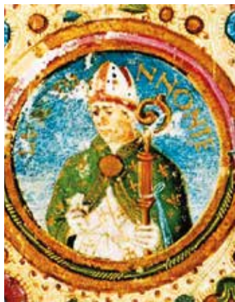
Vitéz János feltételezett portréja

Az első magyarországi nyomda szempontjából különös fontosságú a Chronica Hungarorum ajánlása, amely az egyetlen írott forrása a magyar nyomdászat kezdetének. Hess a Budai Krónika nyomtatásához 1472 nyarán kezdett hozzá. A támogatás elmaradása magyarázhatja, hogy a nyomtatás tíz hónapig elhúzódott. Hess ajánlásában említi: hite