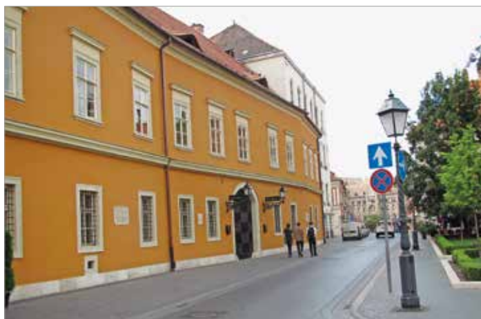
A Hess András tér 4-es számú ház, ahol valószínűleg az első hazai ősnyomda működött

alkancellár közvetlen hívására érkezett Itáliából 1471 (egyes vélemények szerint 1472) késő tavaszán Budára. Vitéz már korábban értesült a szöveg-többszörözés új lehetőségéről, amely felkeltette érdeklődését. A budai királyi udvarban tevékenykedő humanista kör szá-