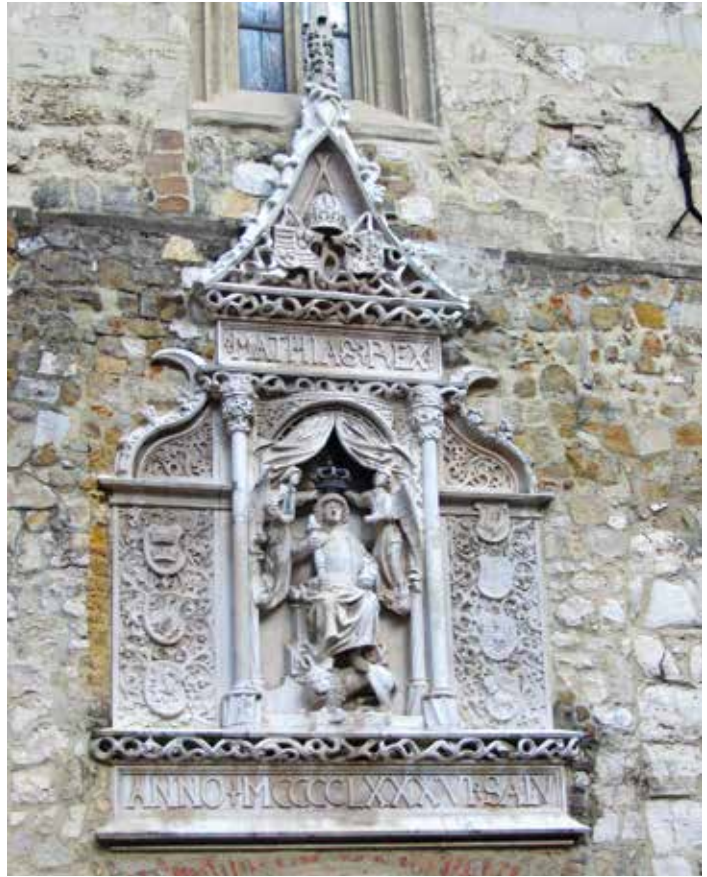
Mátyás király kőbe vésett alakja a Budai Várban

Mind a tíz fennmaradt példánynak külön története van, amelyet a kutatás mára feltárt, hiszen az ebből a Budán rendkívül korán létesült könyv-