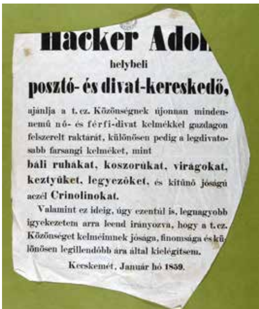
Kereskedelmi reklám, 1859. A nyomtatvány szabásminta darabjaként maradt meg

sal küldte csomagjait, és írta leveleit távol levő fiainak, rokonainak és anyósának, akivel felesége korai halála után is tartotta a kapcsolatot. 2