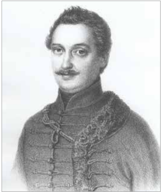
Katona József. Barabás Miklós litográfiája, 1856

A terjedelmesebb magánlevelek egyik központi témája a család és a rokonság. Az idősödő nyomdatulajdonos szeretettel és gondoskodás-