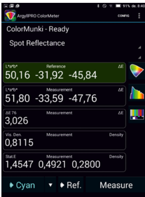
2. ábra. Az ArgyllPro nyomdai mérésekre kialakított képernyője

eredményét megjeleníti L^*a^*b^* , RGB és HTML értékekkel, így a weblapok készítésénél is hasznos információt kapunk. A nyomdákban azonban többnyire másként használják a spektrofotométert, mint a stúdiókban, s a mérési eredmények megjelenítéséhez szükség van egy laptopra, ami körülményessé teszi a használatát.