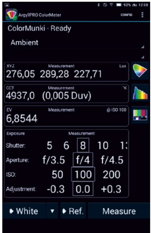
4. ábra. Külső fényforrás mérése az ArgyllPro programban

Nagyon sok funkciója van, alig hittem a szememnek. A Config menüben előre meghatározott mérési készletek közül választhatunk, de az egyes sorok a képernyőről kihúzással eltüntethetők és sorrendjük is felcserélhető, ahogy azt az androidos programokban megszokhattuk. Természetesen fekvő és álló módban is képes működni. Az üzemi gyakorlatban a legtöbbször az összehasonlító mérésre van szükség, amikor