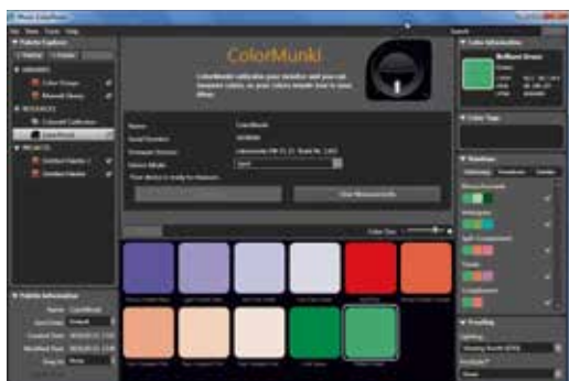
1. ábra. A ColorMunki Photo Color Picker ablaka

A spektrofotométerek alapjában véve elég nagy mérőeszközök, de az utóbbi időben megjelent az X-Rite cég ColorMunki műszere, aminek mérete és megjelenése körülbelül egy nagyobb mérőszalagával egyezik meg, s könnyű, akár magammal is hurcolhatnám, ha lenne kijelző hozzá. A tervezés során az X-Rite a fényképezéket és a stúdiókat célozta meg. Minden olyan funkcióval rendelkezik, melyre egy DTP-s szakembernek szüksége van. Lehet vele monitort kalibrálni, laptopét is, színprofilt készíteni CMYK vagy RGB színtérben működő asztali nyomtatókhoz, természetesen reflexiós minták mérésére is alkalmas, ahogy azt az 1. ábrán láthatjuk. Az egyes színezeteknek minden esetben nevet is ad a program, így segít azok meghatározásában a hétköznapi beszédben. Az egyes minták mérési