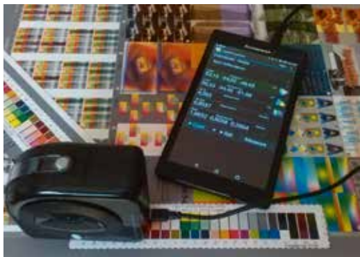
5. ábra. ColorMunki működés közben

A ColorMunki spektrofotométer nagyságát könnyű felbecsülni az 5. ábráról, ahol egy 7"-os tablet mellett látható.