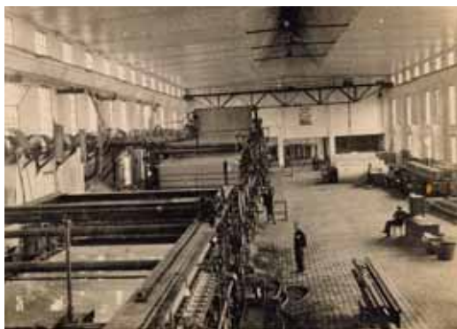
Az 1932-ben vásárolt 4. számú papírgép, 1934-ben

és vidéki gyáregységek iratanyagát is, az iratok döntő hányada a kilencvenes évek elején keletkezett, de találhatóak iratok az 1960-as évekből is, pl. a kutatóintézet beolvadásáról 1963-ból. Az m. állag iratai is vegyesek, a fővárosi központ és a fővárosi-vidéki tagvállalatok műszaki beruházási, technológiai leírás iratai mellett a KGST-iratok, az