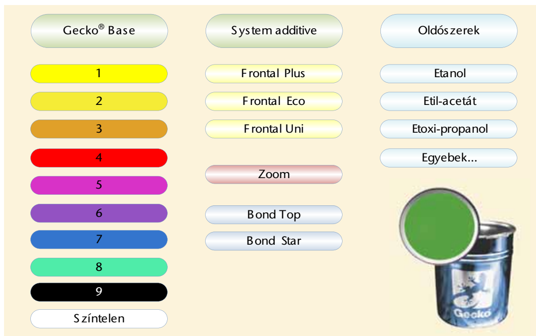
A Gecko® festékek összetevői

Más festékgyártók festékrendszerei ettől eltérhetnek, de alapjaiban hasonló elven működnek.