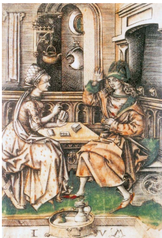
Kártyázók. 16. századi metszet

ünnepi kártyakiadványok emlékeztek a múlt és jelen kártyakészítő művészetére. A gyűjtők ellepték a kártyamúzeum boltját, szombaton pedig városnézés keretében kártyaszentelés volt a Skatkútnál. (A civakodó kártyásokat mintázó szobrot 1903-ban állították a német kártyások. A második világháború idején jelentős kárt szenvedő kutat és emlékművet polgári adakozásból emelték újra 1955-ben.)