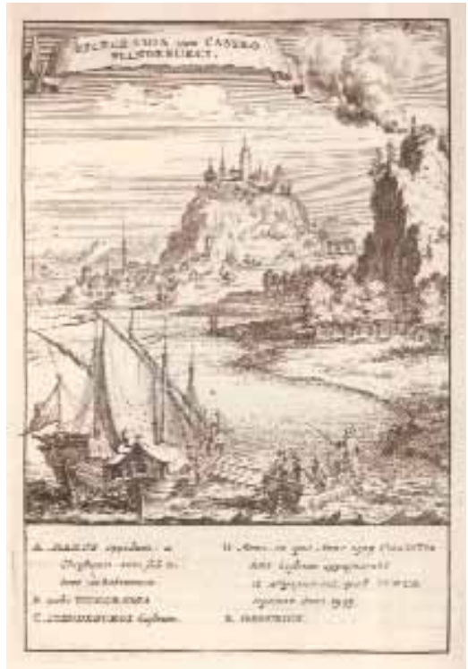
4. Hajók Visegrádnál

A bécsi vám kifizetése után a következő állomás az Ausztria határát képező Hainburg volt (az irat Hamburgként említi), ahol szintén vámot, illetve „mázsálási” költséget kellett fizetni. Az ország területére való belépés Dévényben újabb vám kifizetésével járt. Pozsonyban harmincadot és vámot kellett leróni. Az út további állomásai Komárom, Esztergom és Vác voltak. Mint a következő településnevek is bizonyítják, a felszerelést itt rakták szekerekre, a szekeres „Vácztól fogva Kolozsvárig való szállításáért másájától Ft 8”-at kért. A szárazföldi út Hatvanon, Egeren, Ónodon, Debrecenen át vezetett, majd a bihari Székelyhidon, Margitán (Margitta) és a szilágyi Cigányin át jutottak el Erdély szívébe, Kolozsvárra. E helyeken újabb vámokat, valamint a helyi kereskedők által szedett ún. „látópénzt” kellett fizetnie annak, aki Bécsben vásárolt betűkből kívánt nyomdát alapítani Kolozsvárott. A vámok és a szállítási költség mellett egyéb járulékos költségek is terhelték a betűk beszerzőjét. Költeni kellett a „mestertől Lobingertől való be szállításért”, a „ládák csináltatásá”-ért, a betűknek ládába rakásáért stb., nem beszélve a „Bécsben fenn mulatozván” szükséges pénzről és „egyéb apró költségek”-ről. Sőt még az „infláció” is sújtotta, „mivel akkor a 36 pénzeseket 34. szállítot-