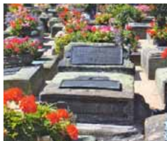
Dürer sírja a nürnbergi temetőben