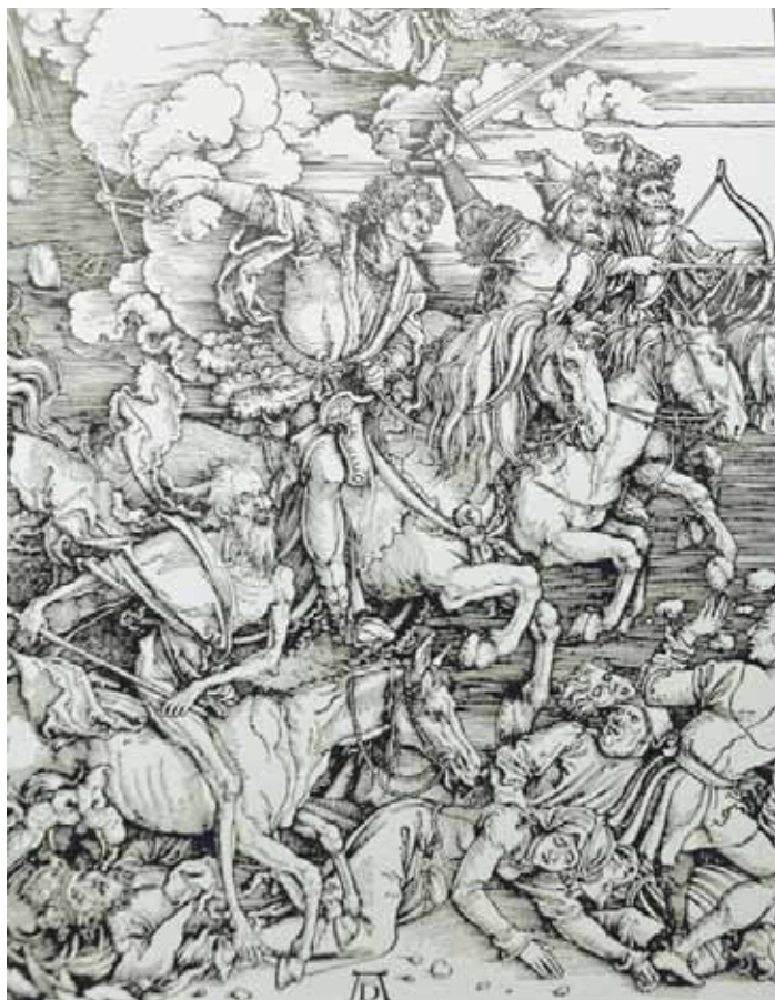
Négy lovas metszet az Apokalipszisből