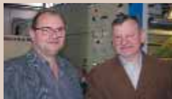
A szakmai tanácskozás az üzemlátogatáson folytatódott