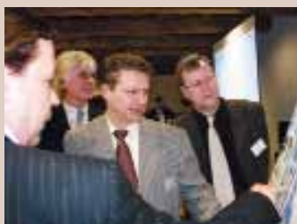
Az érdeklődő közönség