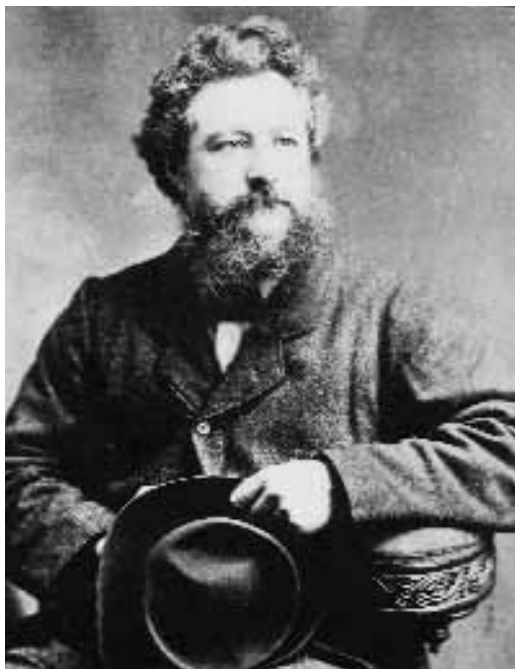
William Morris, 1877

Morris a ruskini példából kiindulva A gyár, amilyen lehetne című cikksorozatában írja le az általa meg-