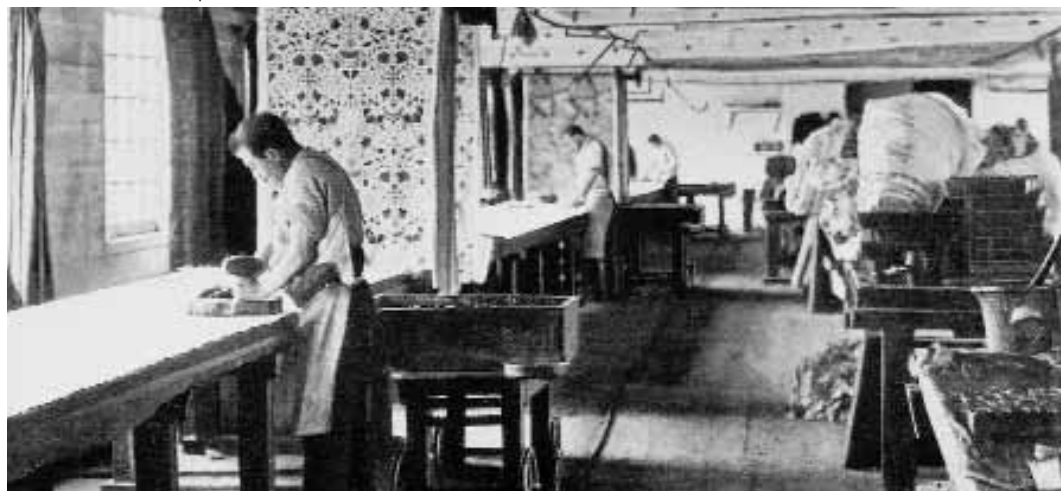
Munka Merton Abbey-ben