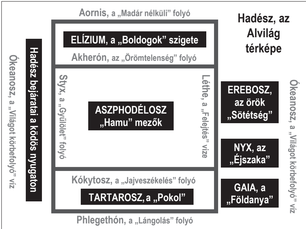
2. ábra: A Hadész alvilági tartományai és vizei