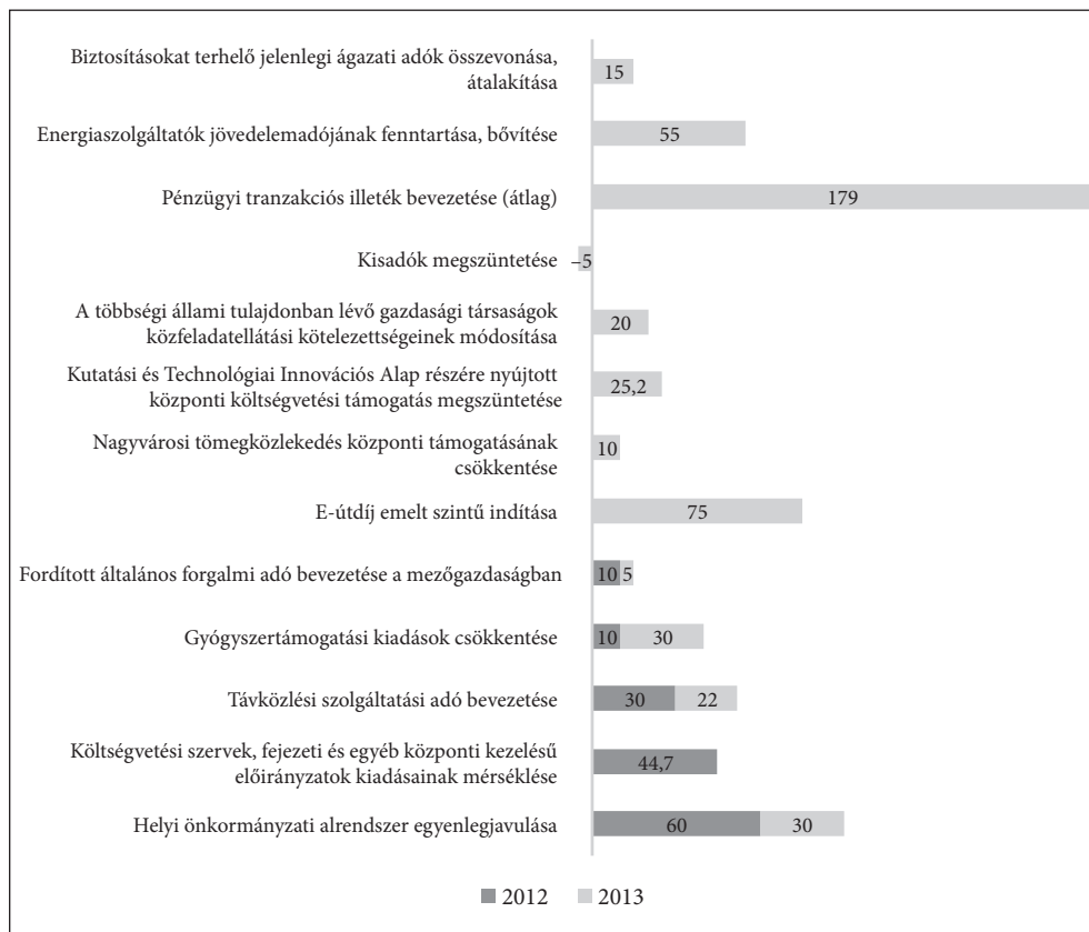
1. ábra: Strukturális kiigazító intézkedések a 2011-es konvergenciaprogramhoz képest a 2012-es konvergenciaprogramban (Mrd Ft)