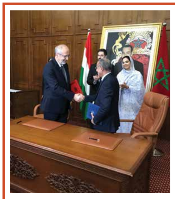
A Marokkói Nemzeti Könyvtár és az Országos Széchényi Könyvtár közötti együttműködési megállapodás aláírása Rabatban