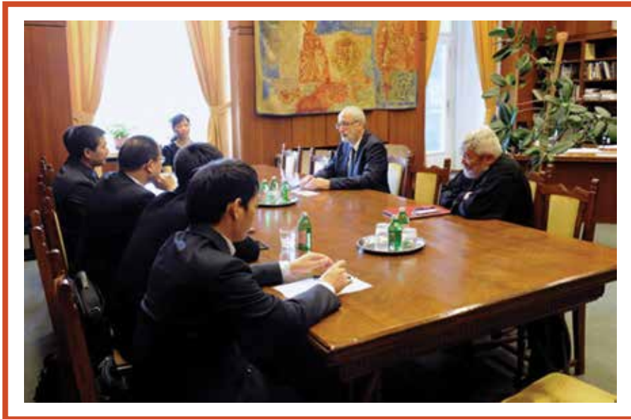
A Kínai Kulturális Minisztérium delegációja az OSZK-ban