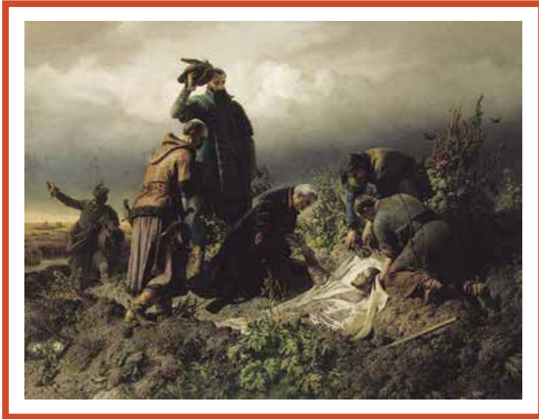
Székely Bertalan: II. Lajos holttestének megtalálása

igazságügyi orvosszakértő. Hát az antropológus? Mi volt a véleménye a nyomozást lefolytató detektívnek? Hogyan merült fel a gyilkosság vádja, hol történhetett a bűncselekmény és kik lehettek a legfőbb gyanúsítottak? Milyen szerepet játszott a feltételezett felbujtó és mi köze volt ehhez egy házassági szerződésnek? Izgalmas és összetett kép bontakozott ki a hallgatóság előtt, mely további kérdések felvetését és azok bizonyítását is előre vetette.