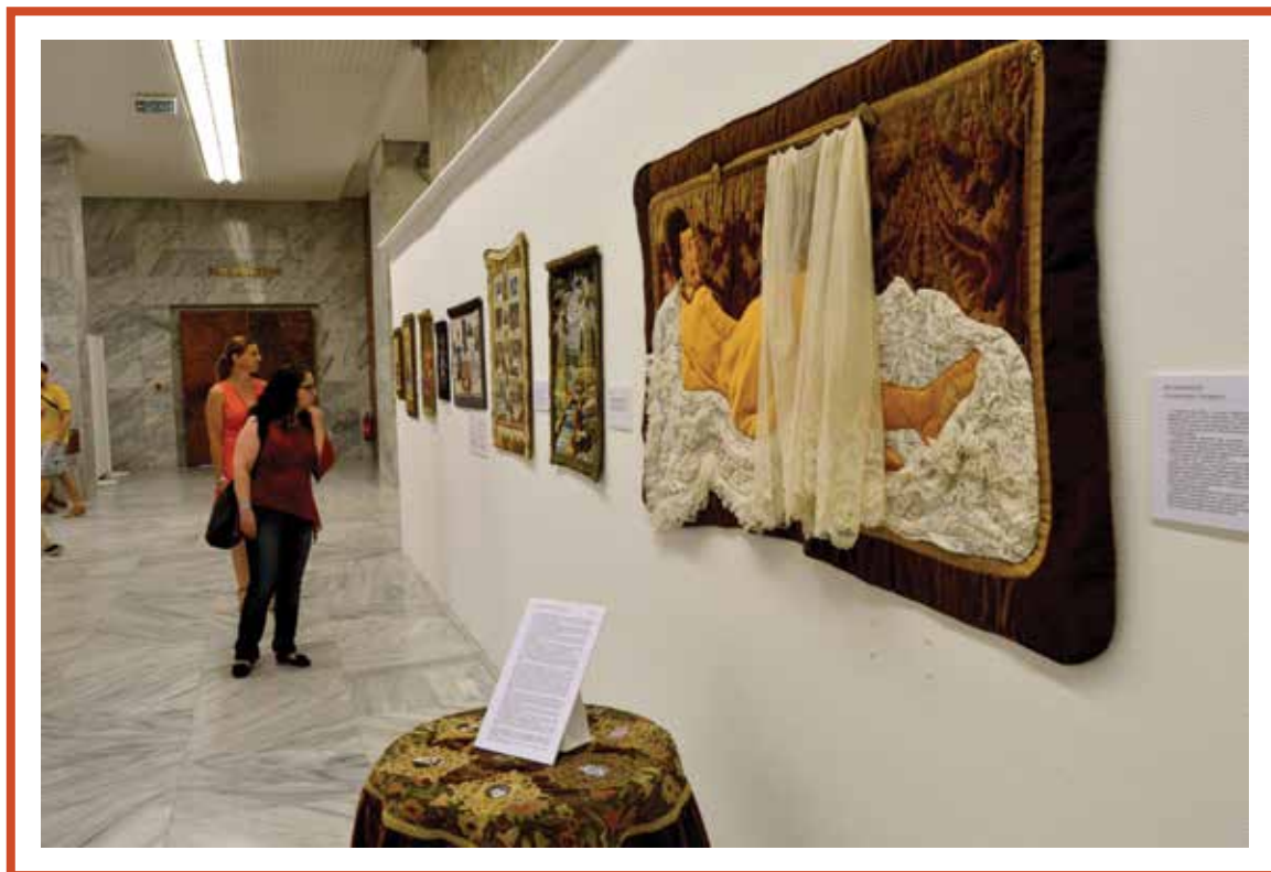
Szeredi Ambrus Noémi tárlata: Mesélő textilek – textiles mesék

De ki is volt Benyovszky Móric? A magyar történelem egyik legkalandosabb életű egyénisége, az egyik leghíresebb magyar világtutató, hajós és katona, az indiai-óceáni szigetvilág első európai uralkodója. Benyovszky 1741. szeptember 20-án született. Az elmúlt évszázadokban születési éve és tevékenységei vonatkozásában is adódtak bizonytalanságok, azonban a tudományos kutatás mára számos, legendák szülte pontatlanságot helyreigazított Benyovszky körül.