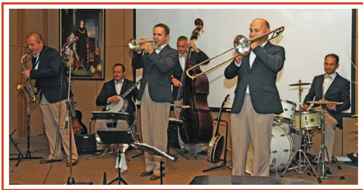
Hot Jazz Band