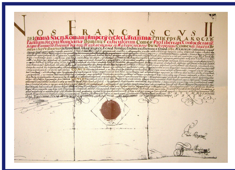
Gönc hajdúvárosi kiváltságlevelé

A csatahelyszínek közül az első, még vesztes dolhai csata (1703. június 7.) hely- színét, ill. a szabadságharc első győztes üt- közétet jelölő tiszaujlaki turulos emlékmű- vet (1703. július 14.) képeslapok idézik, hasonlóan a fontosabb országos gyűlések helyszíneire (Gyulafehérvár, Szécsény, Huszt, Marosvásárhely, Ónod, Sárospatak, Szerencs, Salánk). Ezek közül kiemelkedik az 1707-es ónodi országgyűlés, melynek valódi színtere az Ónod mezőváros közeli körömi mező volt. Itt mondták ki a detroni- zációt, a Habsburg-ház trónfosztását. Rozsnyót a Rákóczi-örtoronnyal Tichy Kálmán metszetén cso- dálhatjuk. A város sokáig a szabadságharc hadiipa- ri központja volt. Rákóczi, szolgálataik jutalmául, több helységet ruházott fel hajdú kiváltsággal: Göncöt (1706), Simontornyt (1707) és Tarpát (1708). A kiállí- táson látható, Gönc részére nyújtott hajdúvárosi kivált- ságlevél szövege pontosan körülhatárolja a város jogait és kötelességeit.