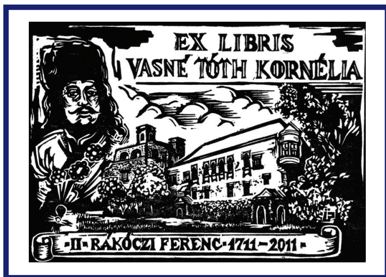
Ex libris Vasné Tóth Kornélia, grafikus Ürmös Péter

A kiállításon felvonultatott plakátok közül több a Rákóczi hadnagya című filmet, annak szereplőit, jele- neteit tárja elénk, de a XX. század nevesebb Rákóczi- kiállításaiába, a sárospataki Rákóczi Múzeum rendez- vényeibe, a Rákóczi-emlékkönyvbe stb. is betekintést kaphatunk. A jelen tárlat címadó plakátja az 1903-as kassai Rákóczi ereklyekiállítás meghirdető plakátot idézi, mely szintén szerepel a kiállításon.