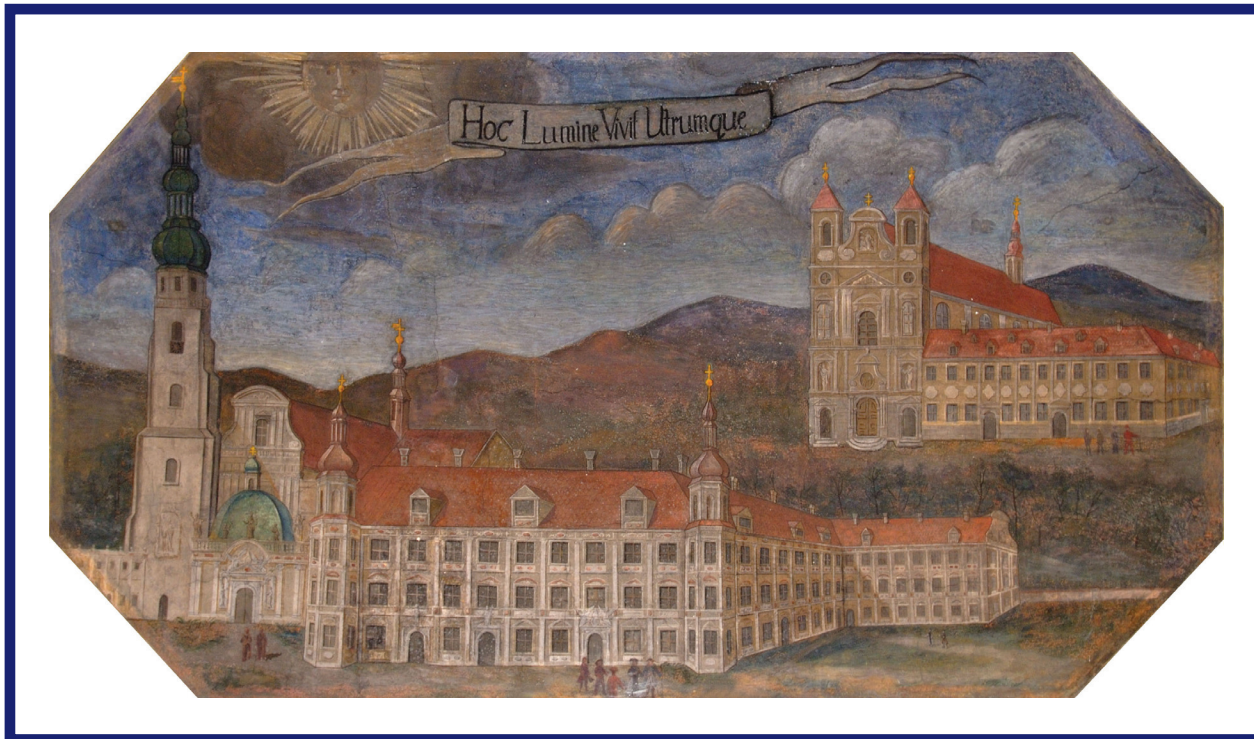
Heinrichau és Zirc barokk apátsága. Freskó a heinrichai apátság fogadótermének mennyezetéről

katalógus 4 167 kötetet tartalmaz. A középiskolai oktatásban való részvállalás szükségessé tette a bibliotéka nagyarányú fejlesztését, amelynek során tankönyvekkel, illetve az oktatást segítő művekkel gyarapodott az állomány. A vásárlások során ügyeltek az értékmentésre is, így került Zirc tulajdonába 10 értékes kódex.