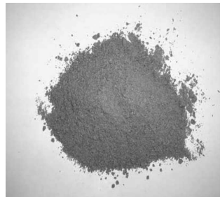
2. számú fénykép