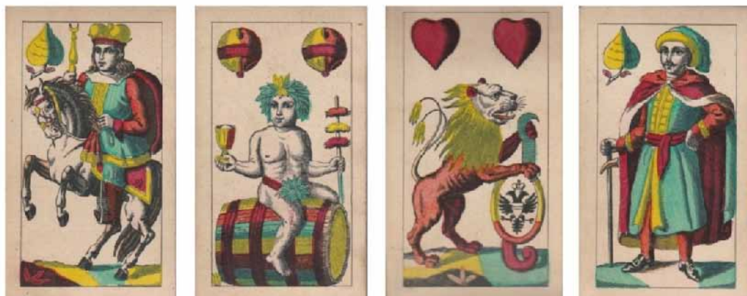
Soproni-képes kártya, Első Magyar Kártyagyár Részvénytársulat, Budapest, 1880 körül

A nemzeti érzelmek kifejezése a XIX. század harmincas éveiben megjelent a játékkártyákon is. Szinte minden műhely és gyár igyekezett ezt a divathullámot követni különleges játékok forgalomba hozásával. Történel-