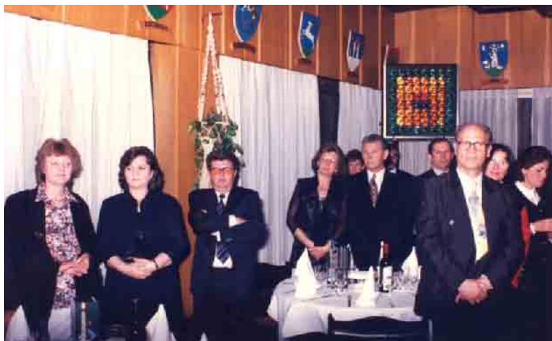
Spliethoff rendezvény, 1996. április 27.