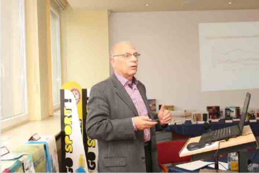
CS+P konferencia, 2016 tavaszán

és a környezetvédők is (amíg voltak) tartottak előadásokat. Ezen a rendezvényen kicsit a csomagolás-fejlesztés határait feszegető, vagy azokat különféle összefüggésbe hozó előadók is előfordulnak. A nap folyamán mintegy öt-hat érdekes előadást hallgatunk meg.