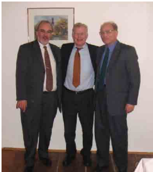
Csepeli és pitteni értékesítési vezetők találkozója 2005-ben

Emellett évente van két olyan rendezvény, amelynek közreműködöm a szervezésében és rendszeresen én vezetek le elnökként. Az egyik a tavaszonként megrendezett Csomagoló nap , ahol a csomagolás fejlesztésével kapcsolatos előadások hangzanak el. Különböző gépgyártók és fejlesztő cégek ismertetik az újdonságaikat. Célja elsősorban az, hogy a résztvevőknek minden évben továbbképző oklevelet tud kiadni az Óbudai Egyetem. Ebben valamilyen formában a CSAOSZ és a PNYME is benne van. Többek között a vonalkódosok