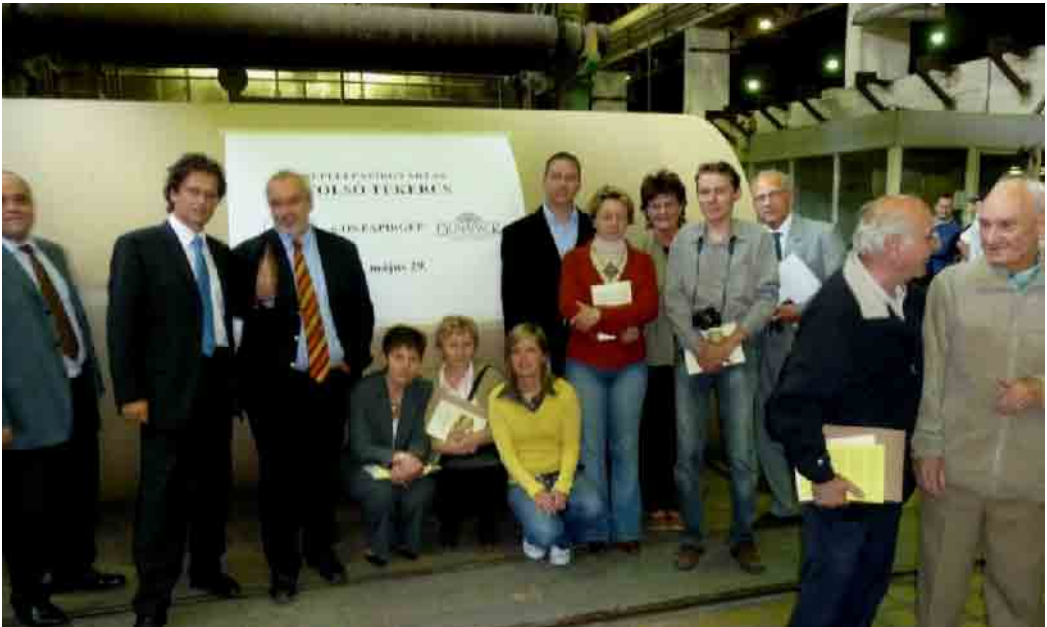
A csepeli 6-os papírgép leállása, 2005. május 29.

– Igen, tulajdonképpen szakmai tanácsadó vagyok, bár ezek csak eseti megbízások. A dolog szellemi oldalát tekintve tehát továbbra is kapcsolatban vagyok valamilyen szinten a céggel, bár a korábbiakhoz képest teljesen más oldalról. Nem a