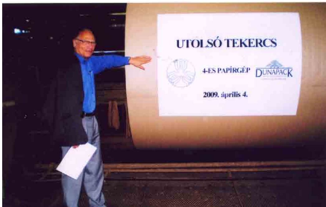
A 4-es papírgép utolsó tekercse, 2009. április 4.