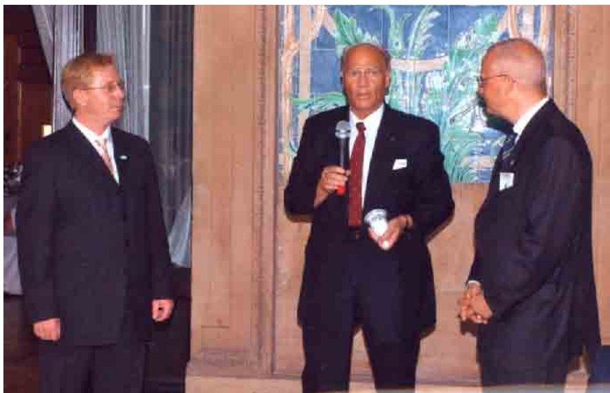
Zellcheming, Wiesbaden, 2005. május

tett. Közgazdasági szempontból, értékesítési oldalról inkább a 35–40%-os piac az elviselhető. Tehát ami felette van, az már veszélyes, az spekuláció, arra hosszú távon nem lehet számítani. Ezt a Dunapacknál éreztük is folyamatosan. Nagy nemzetközi cégek esetében úgy van (a papírgyártásnál kevésbé, de bizonyos mértékig ott is), hogy kettő-három osztatúnak kell lennie a piacnak, mert normális körülmények között senki nem hajlandó az üzletét feltenni csupán egyetlen lapra egy ilyen jellegű profilban.