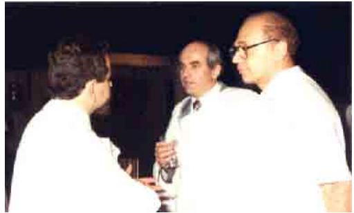
Vevőtálalkozó a Dunafimmél, 1994

– Ez még mindig csak 1991. Egy viszonylag rövid folyamat volt, de miután