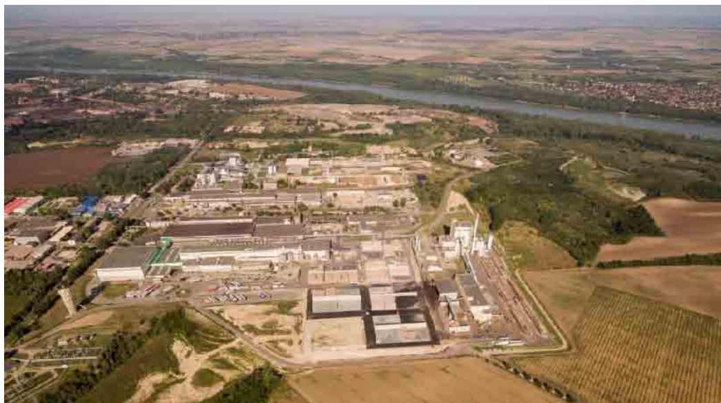
Hamburger Hungaria Dunaújváros most

– Ezt tulajdonképpen nem is olyan könnyű megmondani. A kezdetektől – amikor végleg elköteleztem magam a szakma mellett –, aktív voltam 2009-ig. Addig akkor az 49 év, de még azt követően is három évig nagyon aktívan működtem, tehát az mindösszesen 52 év, de nem