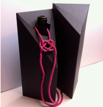
3. ábra Ívesen záródó zsinórdíszes és teljesen zárt doboz

A csomagolás- és grafikai terveket a megrendelő borászat igényeihez alakítottam, a cég képviselői a kezdeti vázlatoktól egészen a prototípus elkészítéséig nyomon követhették a folyamatot. Háromfajta borhoz három különböző címkét és három díszcsomagolást terveztem. A címkékhez látványterveket, a dobozhoz maketteket készítettem.