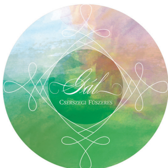
1. ábra Címketerv

Feladatom megoldásához a Gál Szőlőbirtok és Pincészet nyújtott segítséget, az ő boraikat választottam ki arra, hogy hordozzák a jellegzetes mintát.