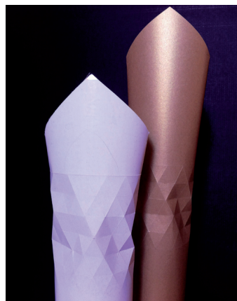
2. ábra A palack nyakán – völgyelések mentén – összenyomható díszcsomagolás

Egy termék új arculatának megtervezése nem egyszerű feladat: szakmai és egyéb területen is kutatásokat kell végezni ahhoz, hogy megfeleljen a megrendelő elvárásainak és felkeltse a vásárlók érdeklődését a termék iránt.