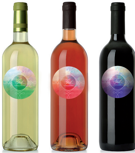
5. ábra Látványterv a címkékkal

A magyar díszítőelemek közül a bocskai zsinór motívumokat használtam fel.