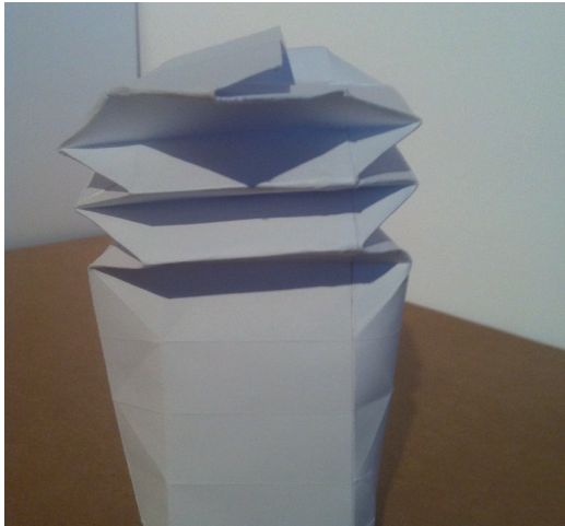
4. ábra A harmonika struktúra

A grafikai tervet a leginkább megvalósítható doboztípusra dolgoztam ki (3. ábra). Ez a harmonika struktúrával rendelkező, laposra összenyomható változat.