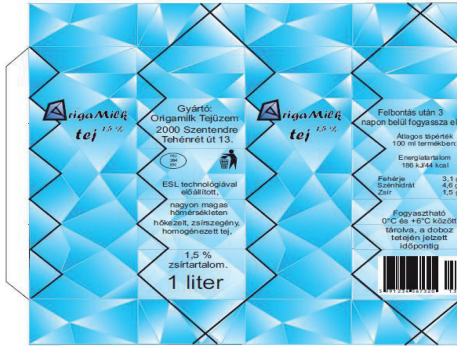
3. ábra A grafikai terv

Az általam tervezett italos dobozt kiürítés után laposra össze lehet hajtani az origami inspirálta új hajtások mentén (2. ábra). A cél egy olyan csomagolás létrehozása, amely mindenki számára elérhető, minden célcsoporthoz szól és van mondanivalója. Kielégíti a fogyasztó igényeit, a működési funkciót, de emellett többletfunkciókat is tartalmaz, mivel esztétikus és környezettudatos is egyben.