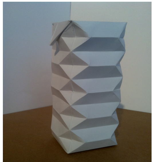
5. ábra Az összenyomható doboz modellje

További előny, hogy egy kisebb gyermek kezűgyességét és egyéb készségeit fejlesztheti ez a gyakorlat, és elvonja a figyelmét, lefoglalja magát valamint a közös tevékenység az anyával csak még szorosabbra fűzi a kapcsolatot közöttük. Mivel ez egy játékos tanítási forma jó élményeket generál és a gyermek valószínűleg a társait is bevonja ebbe a dologba, a kis dobozos üdítőital dobozán be is mutathatja az újonnan tanult mozdulatot, így terjedhet ez a gondolat az óvodákban, iskolákban, majd otthon is, hiszen a gyerekek gyakran tanítják a szüleiket is.