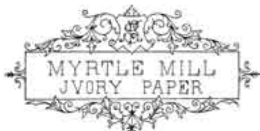
12. ábra. MYRTLE MILL IVORY PAPER préselt vízjel 1915-ből

Ebben az időben a vásárlók körében nagyon kedveltek voltak a különféle női neveket idéző vízjelek is, mint például a THERESIA 1912-ben (10. ábra) vagy a GRAZIELLA vízjel 1914-ben (11. ábra).