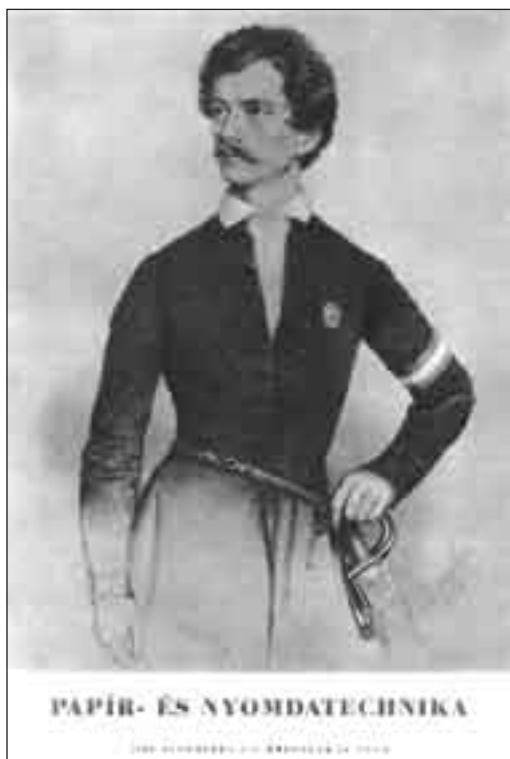
2. kép. A Papír- és nyomdatechnika I. évfolyama 10. számának címlapja. Petőfi Sándor (1949)