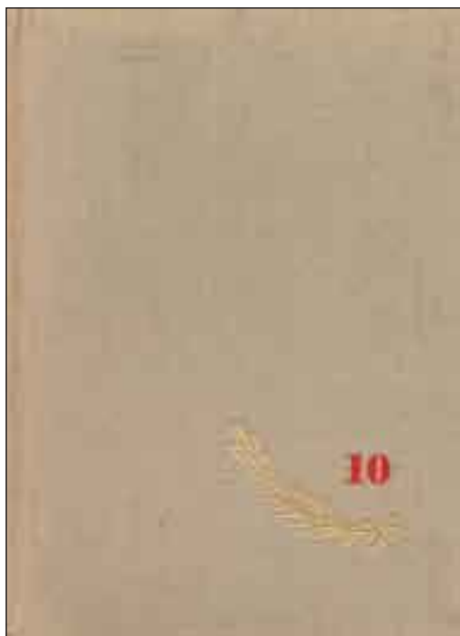
5. kép. A Papíripar 1958-as jubileumi számának címlapja

A jubileumi szám a 6. képen bemutatott 19 cég 10-éves beszámolóját tartalmazza, melyek közül soknak a nevét és a létezését ma már csak a papír őrzi.