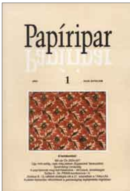
9. kép. A Papíripar XLVIII. évfolyama 1. füzetének címlapja (2004). Dúcnyomásos festett papír a Pialista Központi Könyvtár állományából: Nagyszombat, 1773