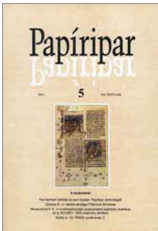
8. kép. A Papíripar XLV. évfolyama 5. füzetének címlapja (2001). A Képes Krónika egy lapja

Színes mellékletek, betétek a kezdetektől megjelentek a lapban: 1957-ben alufóliával kasírozott nátron selyempapír, 1961–62-ben Kóbor Lídia kutatási eredményeinek illusztrá-