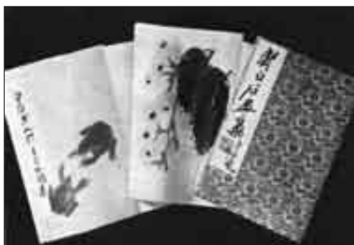
3. kép. Csi Pai-si összegyűjtött fetményei. A Papír- és Nyomdatechnika VIII. évfolyama 9. számának „Magyar Tipográfia” mellékletéből. (1956)