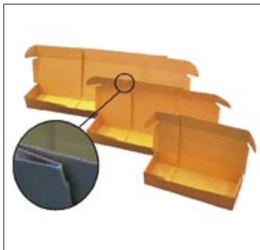
4. kép. Ajtó- és ablakszerelvények csomagolása