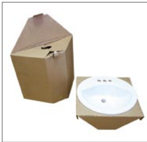
3. kép. Mosdókagyló csomagolása