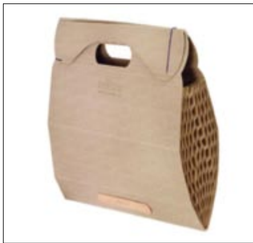
1. kép. Táska mikrohullámból