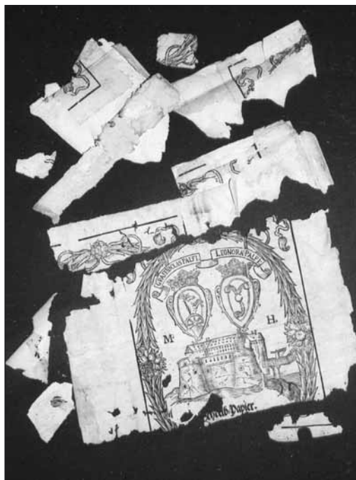
1. kép. Papírtöredék a pergamen borítón restaurálás közben

Ez a nyomtatvány több szempontból is értékes. A rizsmacímkek ritkán maradtak meg a jövő számára, mert a becsomagolt áru szétbontásakor megsérültek, általában letépték és kidobták őket. Előkerülésük meghatározó lehet, újdonság (mint ebben az esetben is), fontos adalékanyagként szolgálhatnak a papírgyártás történetével foglalkozó kutatás számára.