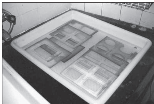
3. kép. Az album szétszedett lapjainak nedves tisztítása

A borítólapokat száraz tisztítás után kíméletesen leválasztottam a kartonalapról, hideg vízben mostam, majd a kalcium-hidroxid, 8-9 pH értékre beállított vizes oldatával kezeltem (3. kép). A fényképek lúgérzékenysége miatt, csak a velük nem érintkező lapkartonokat kezeltem kétszer kalcium-hidroxidos oldattal, ezek pH-ja alacsonyabb volt a borítólapokénál. A lapokat javítás