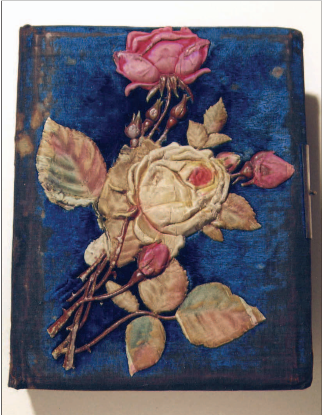
2. kép. A fotóalbum restaurálás után