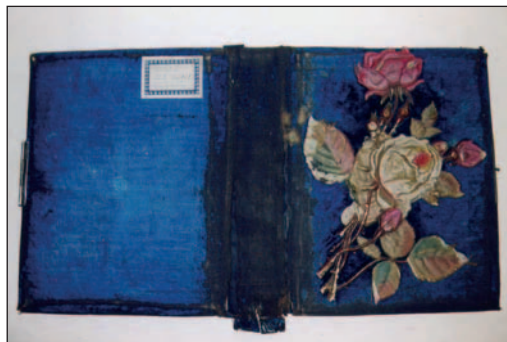
1. kép. Kötés a restaurálás előtt

Az Árpássy féle album kék egészbarsony kötésű. Az első táblát nagy méretű, dombornyomású papíralapra ragasztott, textilborítású rózsacsokor díszíti, amit a minta szélénél egyszerűen körülvágtak. A virágokat és leveleket természetes hatásúra színezték, a textillel nem borított szárrészt festették, lakkozták. A háttábla díszítetlen, a lapok metszése aranyszínű. A két táblát valószínűleg zsanér körül elforduló, pecekre záródó, fém csattal lehetett összekapcsolni. Ez mára elveszett (1. kép).