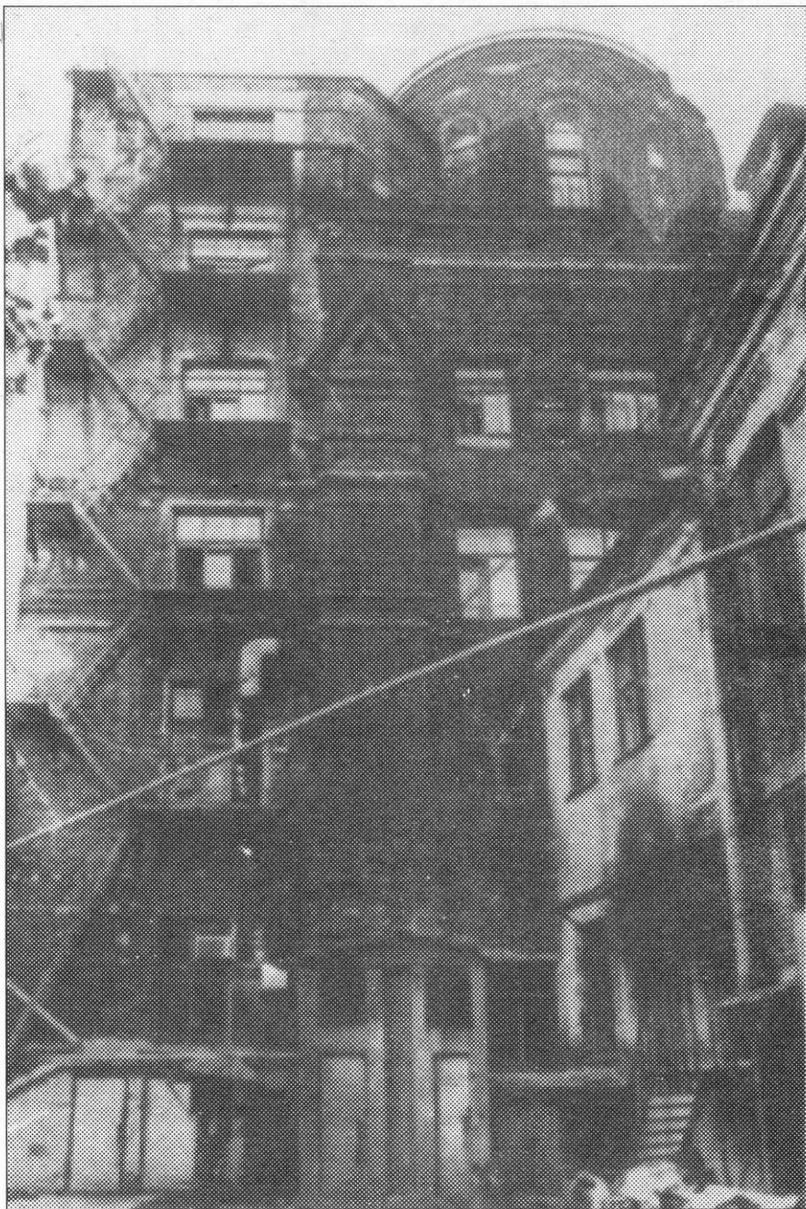
Kötetünk képeinek jegyzéke és a képekről szóló tanulmány a 213–217. oldalon található