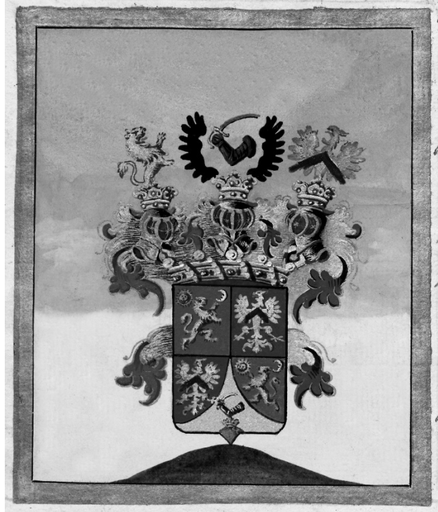
Horváth Mihály bárói címere 164