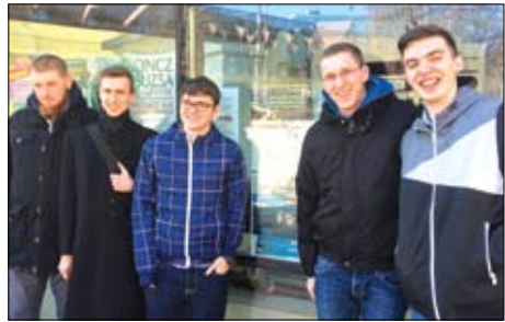
A Karakter 1517 kávézónál

ruktív vitára éhes látogatók. Pénteken vendégeink csatlakoztak az ez alkalommal kibővített tagsággal működő esti alkalmunkhoz, ahol pizza és sör mellett kötetlen beszélgetés és éneklés bontakozott ki. Luther modern követői a vasárnapi istentiszteletünkön köszöntötték a gyülekezetet, majd útnak indultak hazafelé.