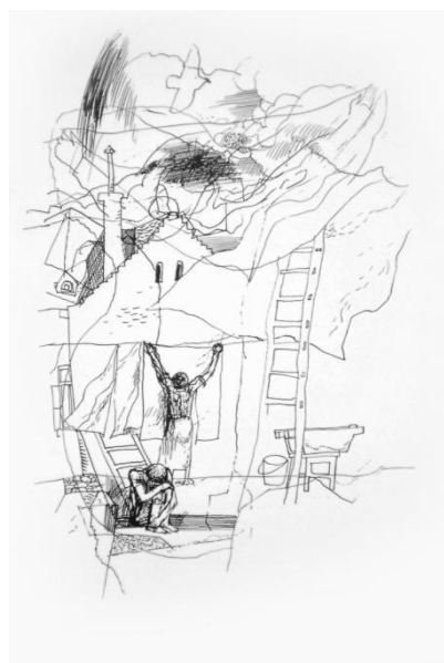
Würtz Ádám illusztrációja