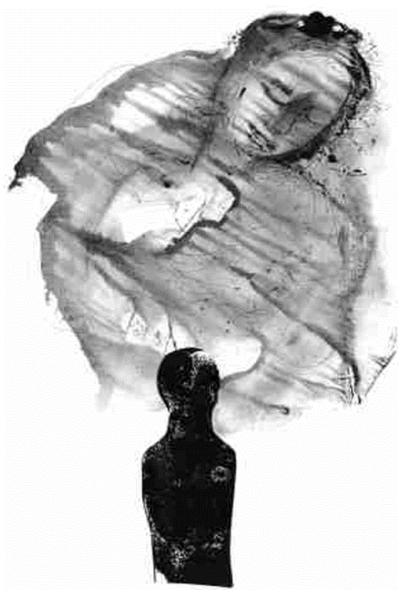
Török Levente illusztrációja

A Mama című vers referenciális jelentését az is befolyásolhatja, hogy a befogadó a költeményt illusztrált kötetben olvassa-e. Azt, hogy a képi illusztráció voltaképpen a grafikusművész interpretációjának egyfajta lenyomata, jól szemlélteti a két következő illusztráció, amelyek mindegyikét József Attila elemzett költeménye ihlette: