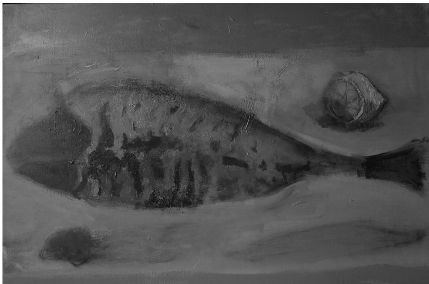
HAL CITROMMAL, 60×90 CM (AKRIL, VÁSZON) 2014.

Aztán persze jöhet a következő lépés: az elbizonytalanodásé. A szerző mind a színpadon, mind a kötetben profin építi fel saját arcmásait, olyannyira, hogy mindenki, aki egyszer is látta, úgy érzi, ismeri a szerzőt. De mégsem tudhatjuk biztosan, vajon mi lehet az arcmások, alteregók, felvett álarcok mögött? Talán a második kötetből ez is kiderülhet.