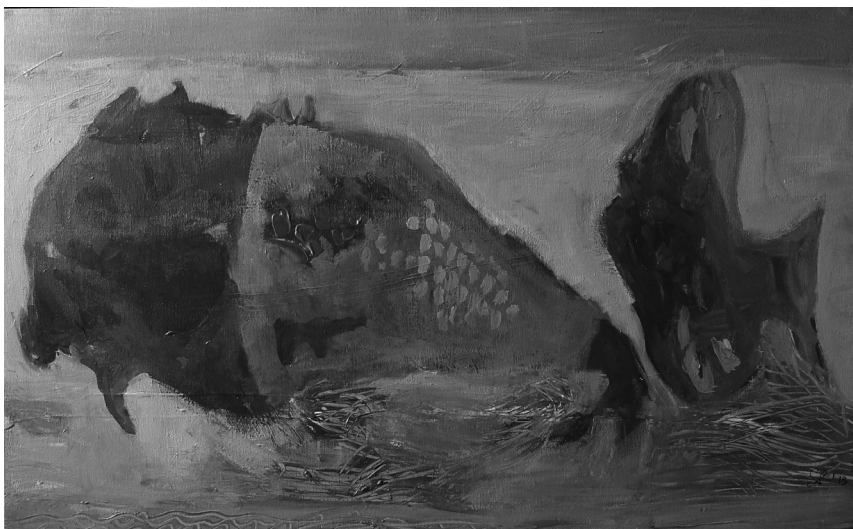
MOZGÓ HALAK, 50×80CM (AKRIL, VÁSZON) 2013.