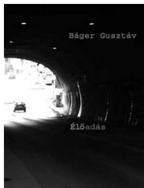
BÁGER GUSZTÁV: Élőadás kötött, 124 oldal, 2100 Ft