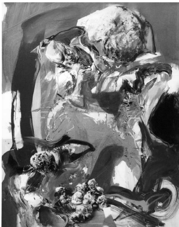
KERÉK FERENC: MORZSÁK