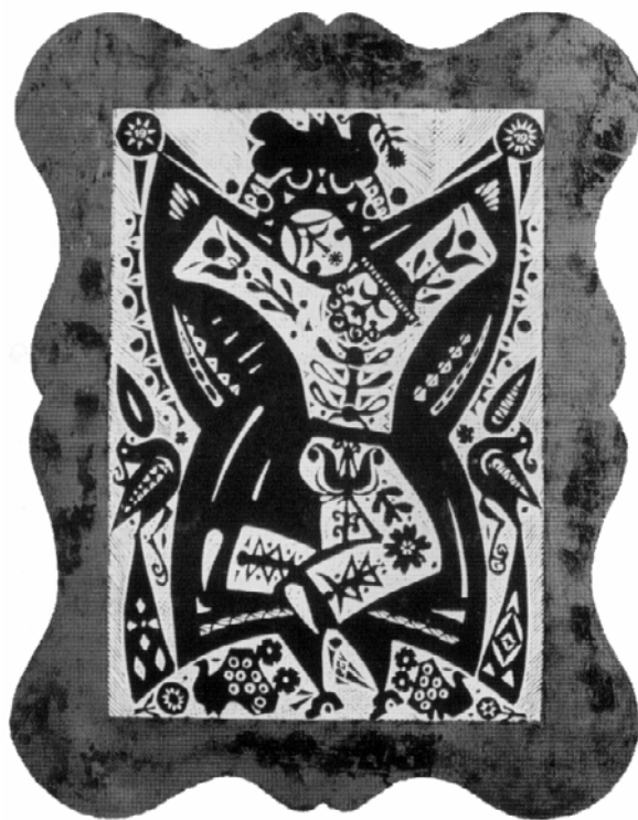
PAPP GYÖRGY: TÜKRÖS

Éj. Szempár. Kavics. Létige. Tükör. Szél. Súgás. Senkise. Rácsok. Csigák. Opál ködök. Üres meder. Alatt, fölött.