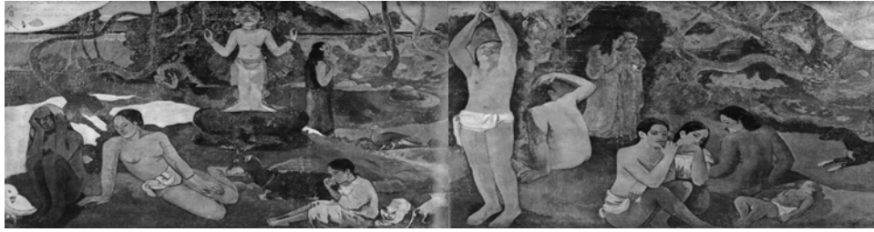
GAUGUIN : D'où venons-nous ? Que sommes-nous ? Où allons-nous ?