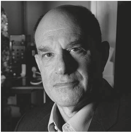
David Julius

Keywords: capsaicin, temperature sensation, pain, touch, mechanosensitive ion channels