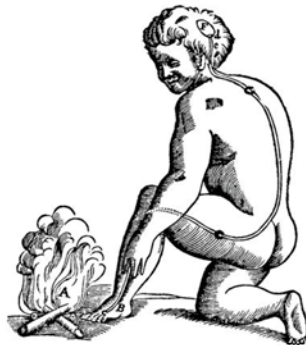
1. ábra. René Descartes Traite de l'homme, 1664

Descartes a meleg ingerek érzékelésére vonatkozó korai mechanisztikus elképzelését bemutató ikonikus illusztrációja mind a mai napig a témával foglalkozó tanulmányok elmaradhatatlan részét képezi, beleértve a szóban forgó Nobel-díj indoklását is. Az ezt követő több mint háromszáz évben számos kiemelkedő kutató foglalkozott az érzékelés, specifikusan a bőr és a zsigerek érző működéseinek vizsgálatával. Az idegtudomány olyan korszakalkotó képviselői járultak hozzá e tudományterület fejlődéséhez, mint Johannes Müller, Maximilian von Frey, Hermann Helmholtz, Charles Scott Sherrington, Edgar Adrian, John Newport Langley, Henry Head, Santiago Ramón y Cajal és Szentágothai János. A múlt század 70-es éveire általánosan elfogadottá vált nézet szerint a bőrt és a zsigereket érő ingereket az elsődleges érző neuronok perifériás végződéseinek modalitás-specifikus receptorai érzékelik, majd a keletkező ingerületet továbbítják a központi idegrendszer felé. Az érző neuronok és receptoraik mű-