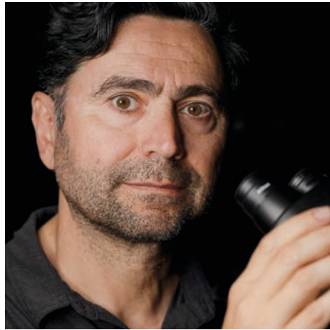
Ardem Patapoutian

A 2021. évi orvosi-élettani Nobel-díjat David Julius amerikai és Ardem Patapoutian Amerikai Egyesült Államokban dolgozó libanoni kutatónak ítélte a Nobel-díj-bizottság a hő- és tapintásérzékelés receptorainak felfedezéséért. A „receptor” jelen esetben a hő- és tapintási ingerekre érzékeny molekulákra utal, amelyek