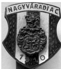
A NAC címere

Mint közismert 1940. augusztus 30-án a második bécsi döntés értelmében Magyarország 43 492 négyzetkilométernyi területet visszakapott Romániától, így jöhettek az erdélyi csapatok az NB I.-be. A Nagyvárad AC 1941-ben Erdély bajnoka lett, és így a magyar élvonalban szerepelhetett. (Vele együtt a Kolozsvári AC és az Újvidéki AC is itt játszhatott.) A NAC az 1941/42-es évadban az előkelő 5. helyen végzett, a következő szezonban pedig a Weiss Manfréd FC Csepel mögött mindössze három ponttal lemaradva ezüstérmes.