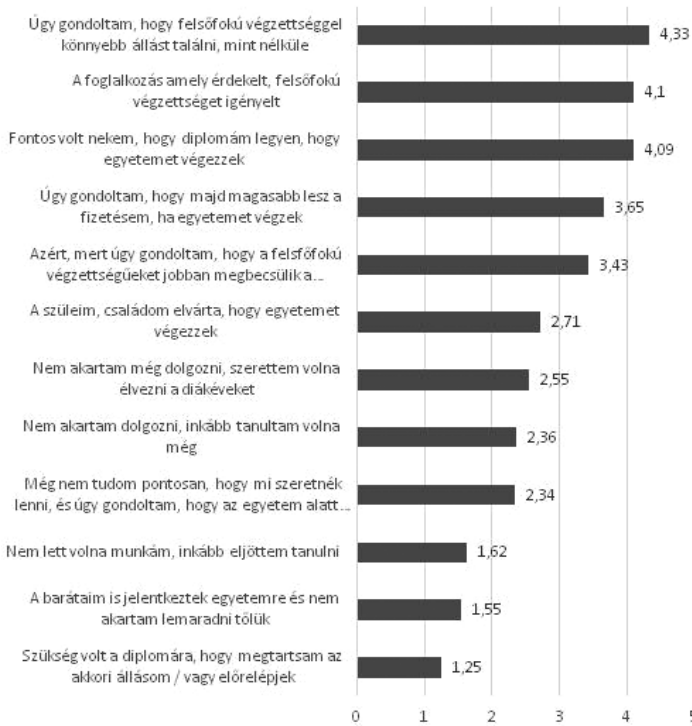
1. ábra. A felsőoktatásban történő továbbtanulás motívumainak átlagértéke

■ Az első két kutatási kérdés a motiváció kérdéskörét járja körbe: Miért mennek a diákok egyetemre? Mi motiválja őket? A munkanélküliség elkerülése, a presztízs, vagy így akarják meghosszabbítani ifjú éveiket? Mennyire függ össze a pályaválasztási motiváció a család anyagi helyzetével? Az alábbiakban ezeket vizsgáljuk.