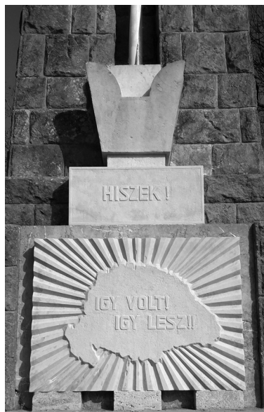
5–6. kép. A rákoskeresztúri országzászló a '48-as emléktáblával (balról), illetve régi-új szimbólumai a 2007-es visszaalakítás után (jobbról)