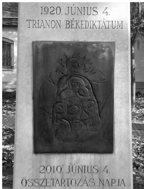
11. kép. A Nemzeti Összetartozás című emlékmű Táton

A Komárom-Esztergom megyei Tát városa 2013-ban állította fel a nemzeti összetartozás emlékművét, amelyet egy domborművel ellátott, három méter magas mészki obeliszk alkot. A bronz domborművön az összetartozást egy család szimbolizálja, központi alakja egy férfi, aki hitvese és gyermekei fölé tart védőköpenyt. Az ábra köré a mai Magyarország körvonalait vésték, „ TRIANON ” felirattal. 40