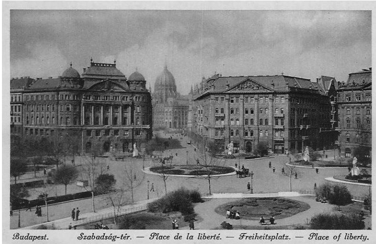
1. kép. A Szabadság tér az irredenta szobrokkal az 1920-as években