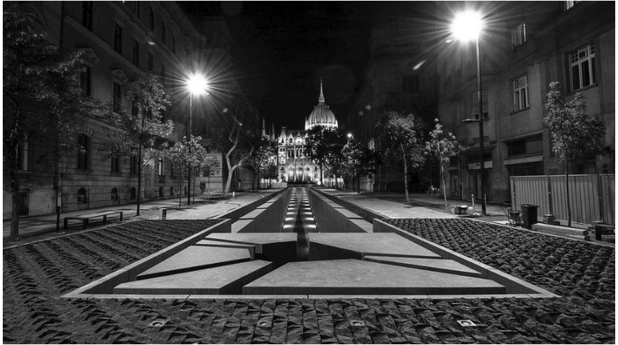
12. kép. A Nemzeti Összetartozás Emlékhelye felülnézetből