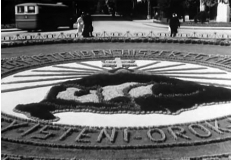
2. kép. Irredenta virággyász a Szabadság téren (Az eredetileg színes kép a Beautiful Budapest c. , 1938-ban készült amerikai turisztikai film egyik képkockája. https://www.youtube.com/watch?v=e-QFTBVU-dA )