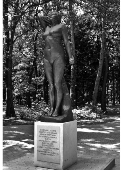
3–4. kép. A Magyar Igazság Kútja Budapesten (balról), és a Magyar Fájdalom Szobra Sopronban (jobbról)