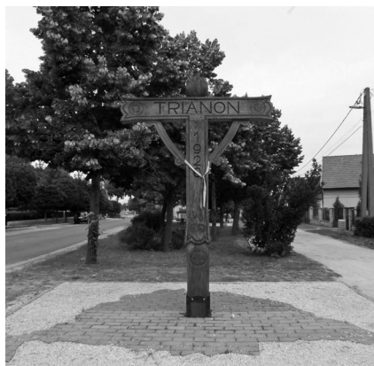
8–9. kép. Leszíjazott turul Várpalotán (balról) és Trianon-kereszt Ecseren (jobbról)

Amíg 1920 után a Trianon elleni protestálás a nemzet közös ügye volt, a 21. századba lépve – a Kárpát-medence erősen megváltozott etnikai összetétele és a nemzetközi politikai tényezők miatt – már egyre kevesebben érzik reálisnak a történelmi Magyarország bármilyen formájú helyreállítását. 2004-ben az Európai Unió tagjai lettünk, a schengeni egyezmény következtében átalakult az országok közötti határok értelmezése, így a revíziós törekvések kivesztek a magyar politikai célok közül. Napjaink fontos célkitűzése, hogy minél jobb és kölcsönösen kedvező gazdasági, politikai viszonyban legyünk a környező országokkal (különösen Visegrádi Négyek csoportján belül), ezen keresztül próbáljuk érvényre juttatni a határon túli magyarok érdekeit, jogait is. A megváltozott körülmények a Trianon-